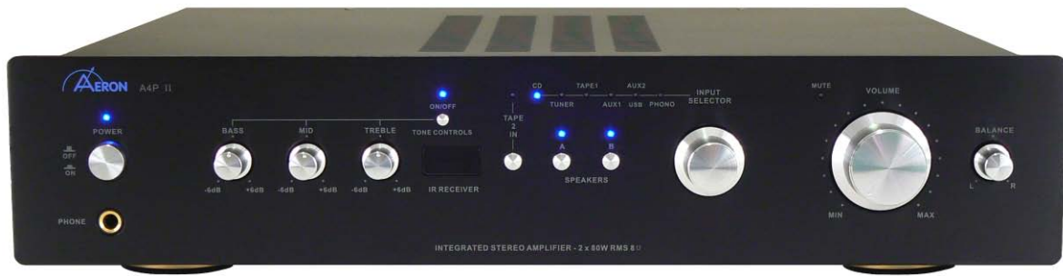
Aeron A4P II