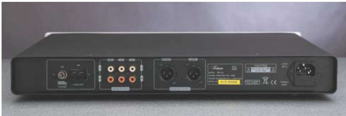
Il pannello posteriore del tuner ha un numero insolito di connettori giustificati dal fatto che esso ha ben quattro uscite linea, tre operate con pin RCA e una, bilanciata, affidata ai professionalissimi XLR.

coniugare prezzi competitivi, un buon livello costruttivo e di design e funzionalità adeguate e conformi a quello che si attende il consumatore esperto.