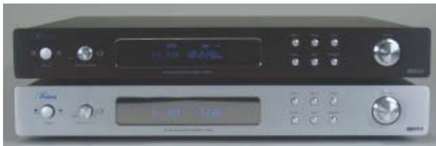
Le due finiture disponibili.

Gli apparecchi dell'epoca "classica" dell'alta fedeltà avevano romantici strumenti a lancetta per la forza del segnale e la sintonia e, a volte, una grossa manopola la cui azione era resa pastosa da un pesante volano. Poi sono arrivati i sintonizzatori PLL, con un feeling tattile forse meno coinvolgente ma più pratici e comodi (grazie alla ricerca automatica e alle memorie) e stabili nell'uso. È in questo quadro che si colloca il sintonizzatore che stiamo per incontrare: offrire tutti i pregi della tecnica moder-